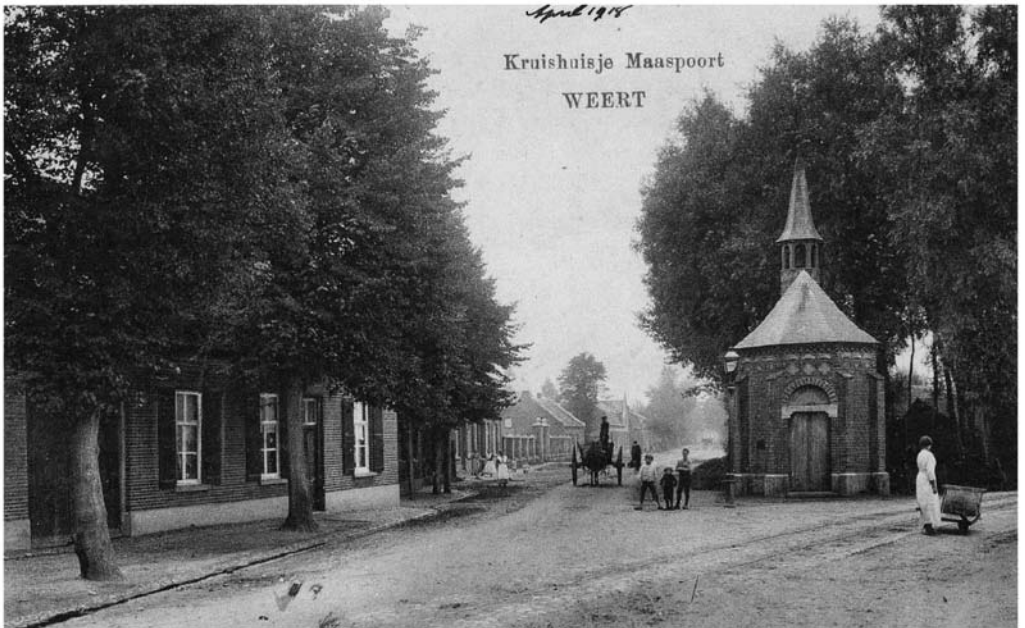
De Maaspoort met het Kruishuisje ( Mathias - kapel ) op het einde van de Maaspoort in 1918. Links het woonhuis van Sjeng Bom. We zien de tramrails afbuigen richting Maas-eikerweg. De kapel werd in 1935 afgebroken.