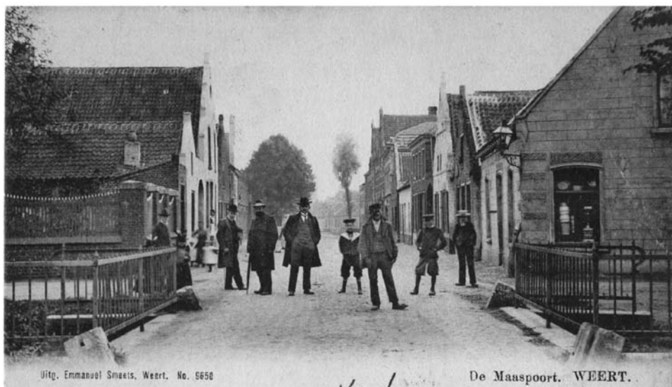
De Maaspoort gezien vanaf de brug aan de Wal in 1905.