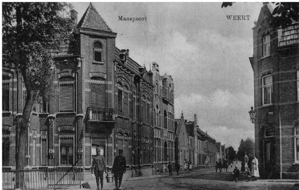
De Maaspoort gezien vanuit de Maasstraat in 1915. We zien twee militairen met een emmer met deksel, wat zou er in die emmer zitten? Men ging in die tijd bij de brouwerij bier halen met kannen en emmers, wie weet.