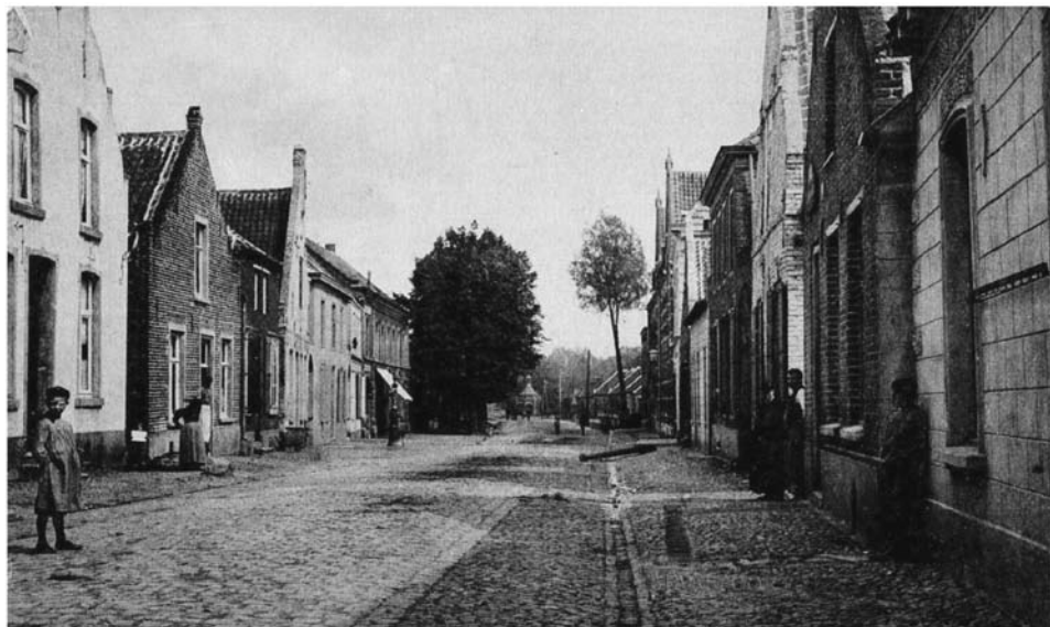
De Maaspoort gezien vanaf de Maasstraat in 1908. Op de kaart staat Biest als straatnaam, doorgehaald en aangepaste naam Maaspoort.