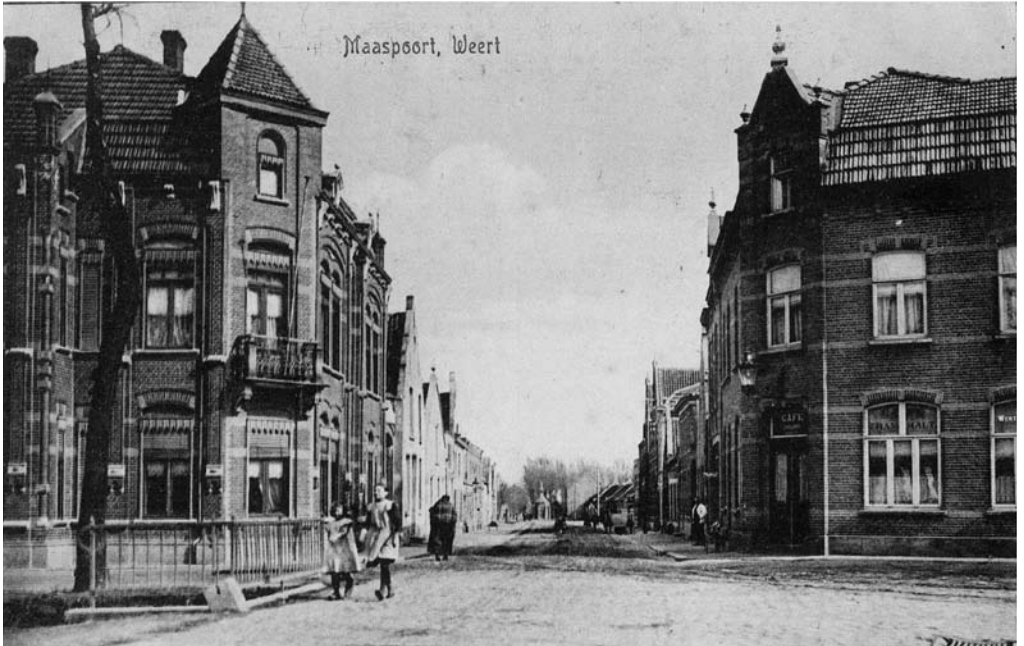
De Maaspoort in 1919 met op de brug twee meisjes op klompen.