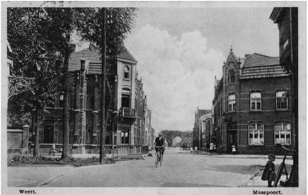
Maaspoort met de brug over de gracht in 1916.