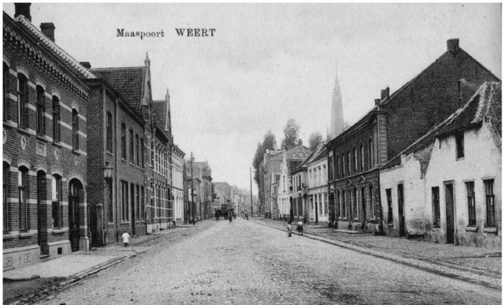
De Maaspoort gezien vanuit de richting van de Mathias Kapel in 1913.