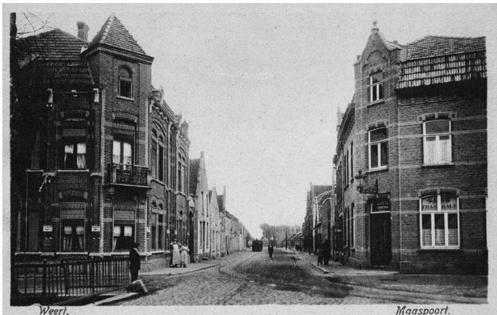
De Maaspoort met in de verte de tram in 1914. Rechts zien we Café Tram – Halt, dit was een halteplaats van de stoomtram. Aan de overkant op de Wal lag ook een café met de naam Tramhalt.