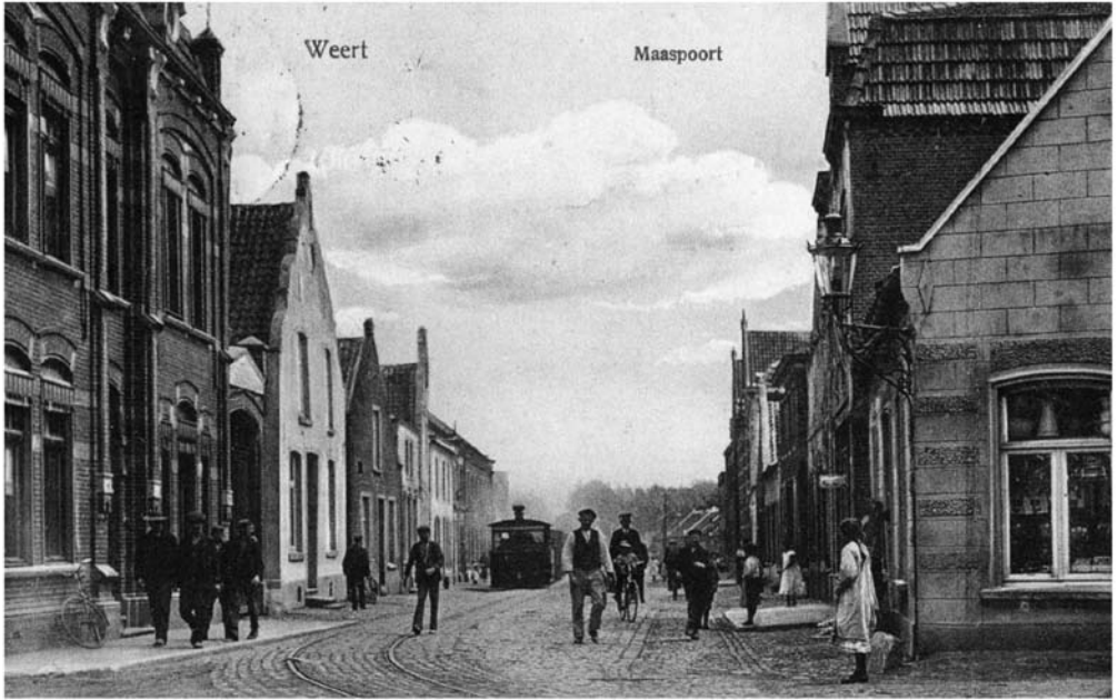
De Maaspoort gezien vanuit de Maasstraat in 1910. Er is veel schoonvolk op straat men moet misschien de tram nog halen naar Maaseik.