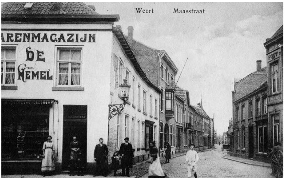
De Maasstraat gezien vanaf de Markt in 1914. Links zien we Sigarenmagazijn en Hotel De Hemel. Boven de stadsverlichting de zonnewijzer uit de 18e eeuw. De prentbriefkaart is verstuurd door een militair tijdens W I en hij schrijft als ik dood ga niet treuren ik kom “ zie de tekst op de voorgevel ”.