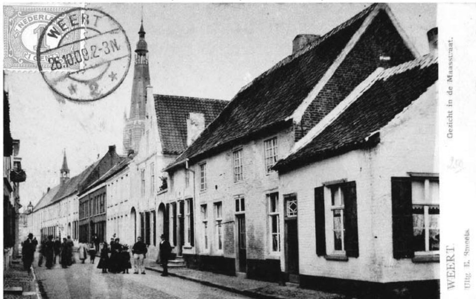
De Maasstraat met op de voorgrond de brug over de stadsgracht in 1904.