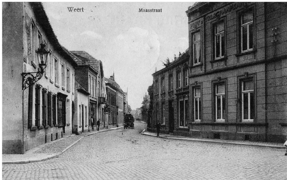
De Maasstraat gezien vanaf de Markt in 1910. Met rechts het postkantoor. Het verkeer wat van Roermond kwam moest door de Maasstraat via de Markt en Beekstraat naar Eindhoven.