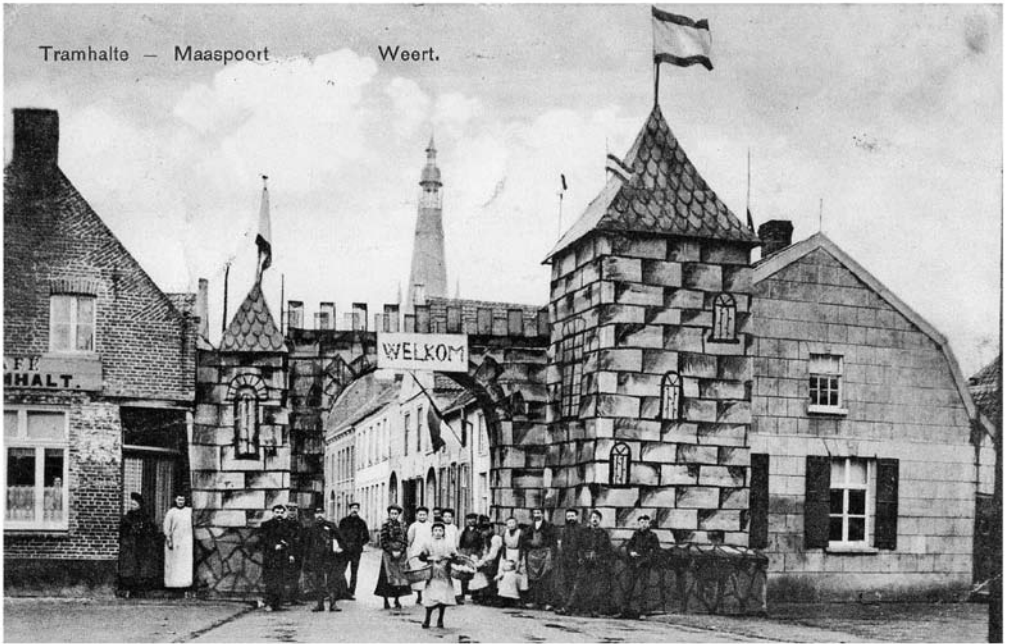
De Maasstraat gezien vanaf de Maaspoort met de ereboog bij de geboorte van Prinses Juliana in 1909.