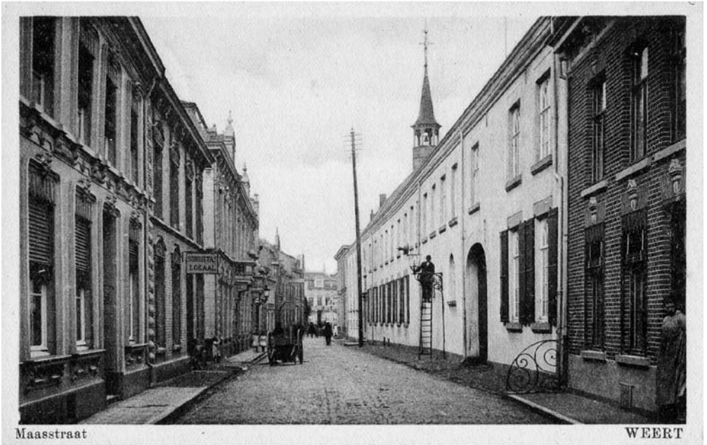
De Maasstraat in 1923 met links ter hoogte van de Kromstraat de kar van de putjeschepper. Rechts is men bezig met onderhoud aan de straatverlichting.