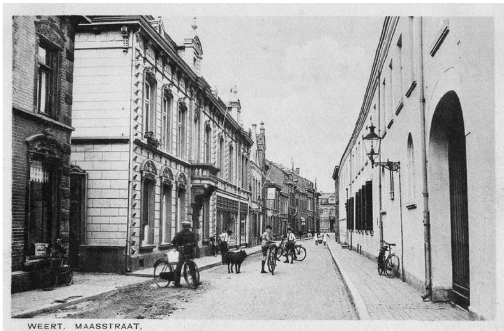
De Maasstraat in 1932 met rechts het klooster van de Zusters Brigittinessen. Links komt een wielrijder uit de Kromstraat.