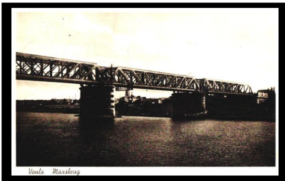
prentbriefkaart van de Maasbrug te Venlo.

Op 9 mei 1940 schrijft sergeant Wout de Bodt gelegerd in de omgeving van Venlo een prentbrief -kaart naar zijn familie in 's – Hertogenbosch. De prentbriefkaart is op het postkantoor s' avonds om 20.00 uur afgestempeld met het Typenraderstempel met kortebalk van Venlo. De militair weet op dat moment niet wat er de volgende dag gaat gebeuren . Om vier uur s' nachts trekken Duitse troepen de Nederlandse grens over en is Nederland in oorlog met Duitsland.